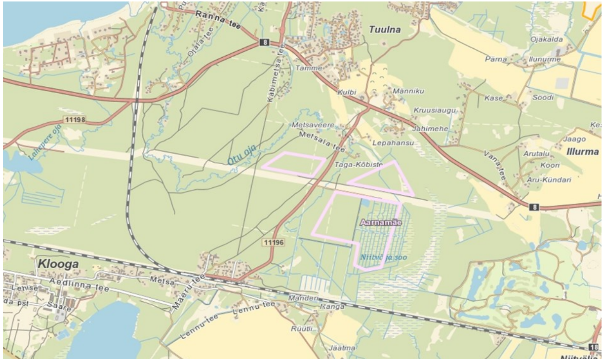
Kavandatava tegevuse asukoht.

Taotletava mäeeraldise teenindusmaa pindala on 57,60 ha, sh mäeeraldise pindala 52,37 ha, mis ruumiliselt paiknevad kolmel lahustükil. Ehitusliiva taotletav kaevandatav varu on 1864 tuh m 3 , millest veetalune 1779 tuh m 3 . Keskkonnaluba taotletakse 15 aastaks.